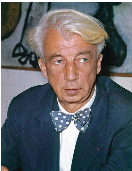
Wil Sandberg in zijn laatste jaar als directeur van het Stedelijk Museum van Amsterdam, 1962.