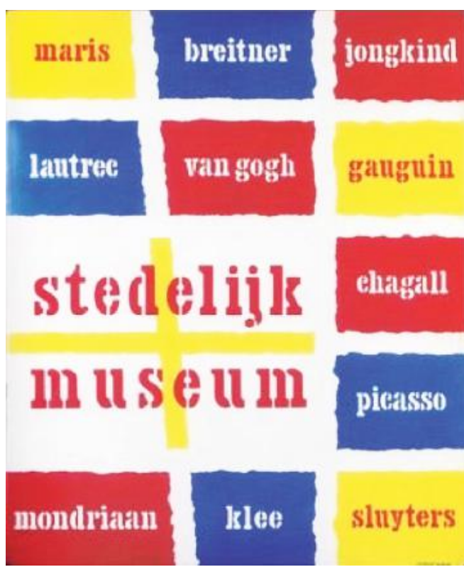
Geëmailleerd reclamebord voor het Stedelijk Museum, 1954 2 .