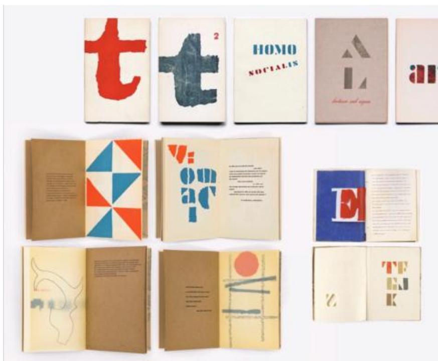
Een aantal van de deeltjes uit de serie experimenta typografica van Willem Sandberg.

hij gebruikt snippers die hij op straat vindt, servetjes, pakpapier, soms gekreukt uit een prullenbak gehaald, enveloppevoeringen en tijdschriften. Het is een keerpunt in zijn ontwikkeling als grafisch vormgever. Hij drukt zichzelf en zijn situatie op een uitzonderlijke manier uit met een zeldzame variatie aan vormen. Hij knipt, scheurt, tekent, schrijft, waarbij hij gebruikmaakt van teksten van filosofen als Henri Bergson en Nietzsche. Sommige daarvan had hij al jaren daarvoor verzameld. Het resultaat is heel bijzonder. Zijn grafisch werk krijgt vanaf dat moment een geheel eigen gezicht, dat na de oorlog van invloed zal zijn op een hele generatie jonge ontwerpers.