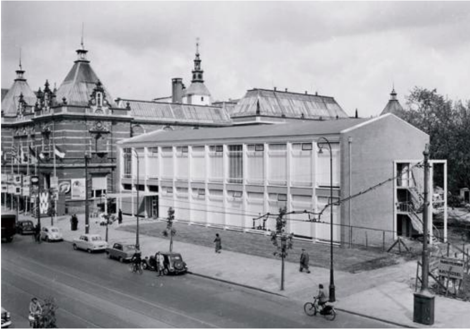
De nieuwe vleugel van het Stedelijk Museum, 30 augustus 1954.