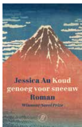
Jessica Au, Koud genoeg voor sneeuw , vertaling: Marion Hardoar, Uitgeverij de Arbeiderspers, 160 pagina's (€ 20,00)

In de herfst reizen een dochter en een moeder naar Tokio. Ze lopen 's avonds langs de grachten, schuilen voor de tyfoonregens, delen maaltijden in kleine restaurants en bezoeken galeries volgens een door de dochter opgesteld programma. Al die tijd praten ze: over het weer, over horoscopen, over kleding en voorwerpen, over familie, migratie en herinnering. Maar wat is het werkelijke doel van hun reis?